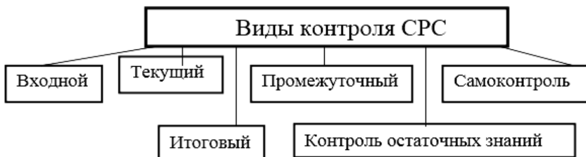
Виды контроля СР

Наряду с традиционными формами контроля используются методы, основанные на современных образовательных технологиях, должна поощряться активная работа студентов, а также более быстрое прохождение ими программы обучения или отдельных ее разделов.